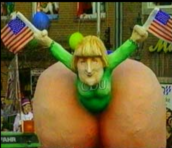
In den Arsch gekrochen