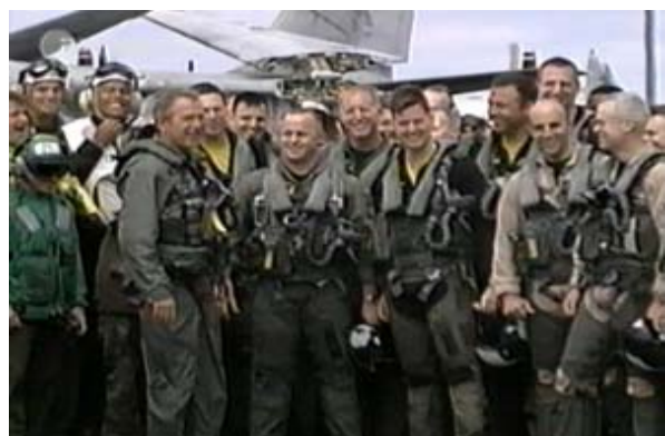
Die Metzgermeister und ihre Jungs, die einen guten Job machen.

So reizvoll dieses Wortspiel auch ist, ganz korrekt ist es nicht. Der Metzger führt Schlachtvieh auf die Schlachtank, Typen wie Bush und Hitler führen Menschen auf die Schlachtbank. Im Ergebnis ist es aber gleich. Am Ende steht immer der Tod und der Profit!