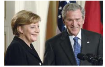
Ein Freund der Soldaten und der Kinder